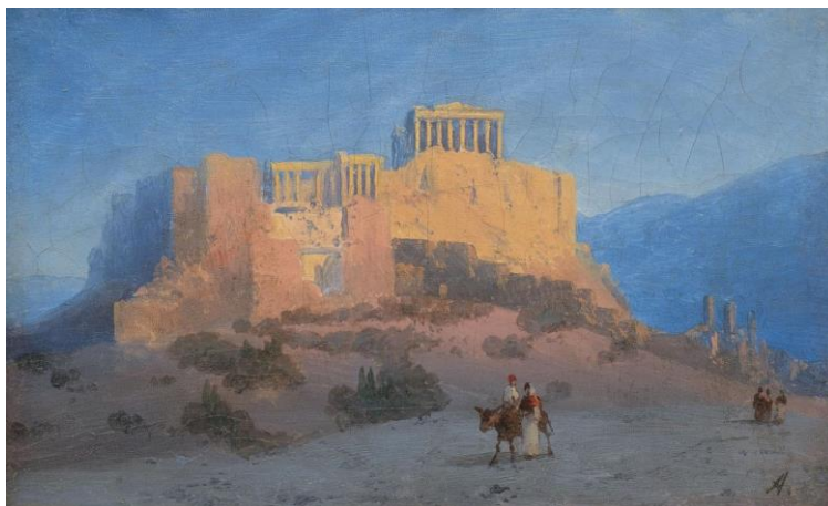
И.К. Айвазовский «Афины»