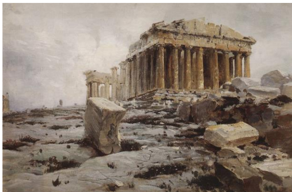
В.Д. Поленов «Храм Афины-Парфенос»

Лучшая техника для этой работы конечно краски. Работу можно выполнить в энергичной манере с помощью противопоставления контрастных цветов: желтого и синего, оранжевого и фиолетового, красного и бирюзового, а также контрастов светлых и темных тонов. Работа получится яркой, живой и торжественной. Эта работа может занять немало времени, она требует большой эмоциональной отдачи.