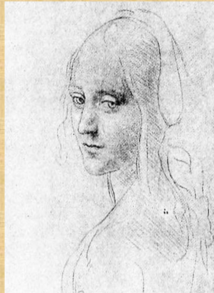
Леонардо да Винчи