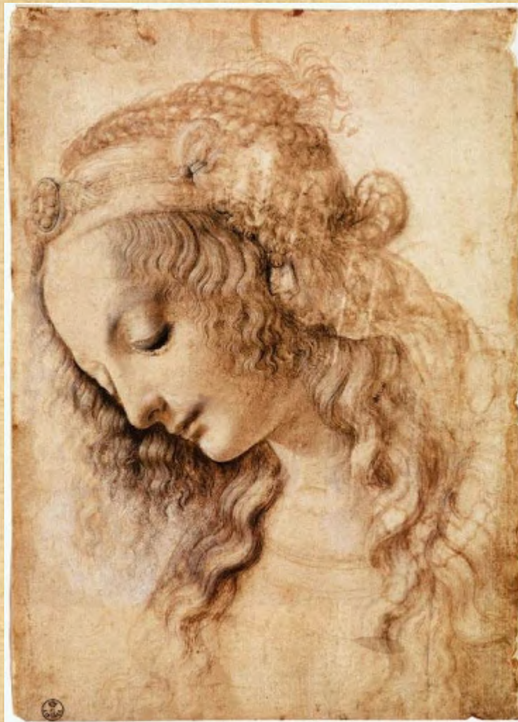
Леонардо да Винчи