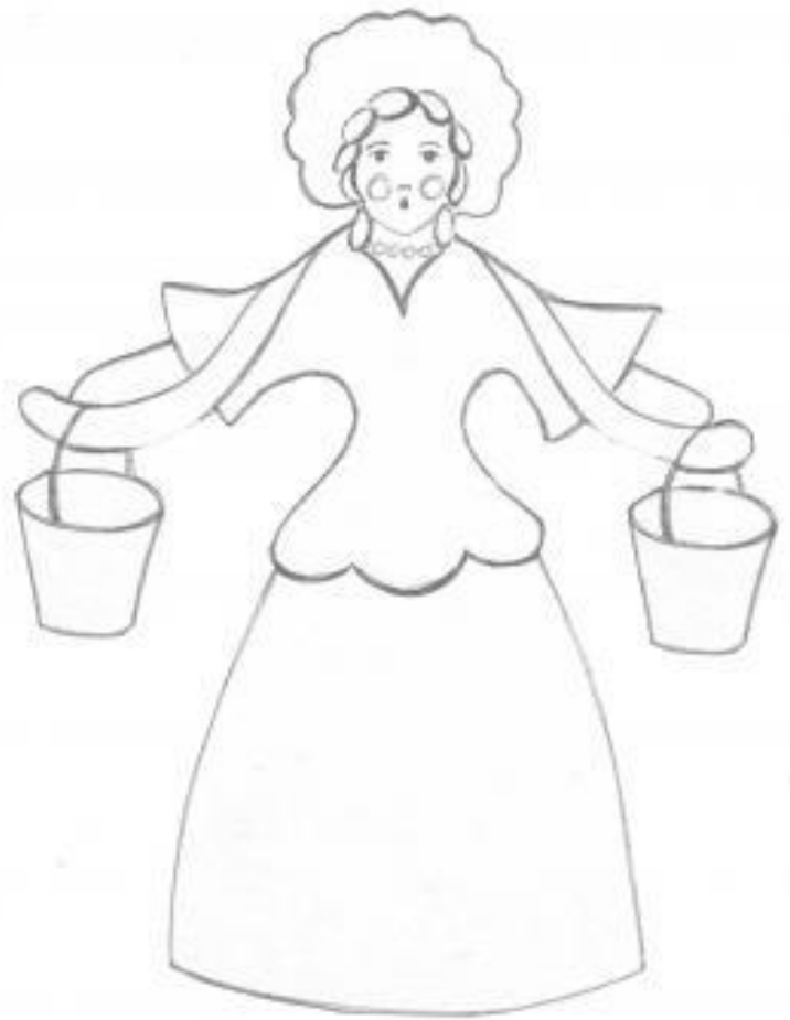
Фото или видео-отчет выполненного задания присылайте на почту ukm211197@yandex.ru и в нашу группу What's App.