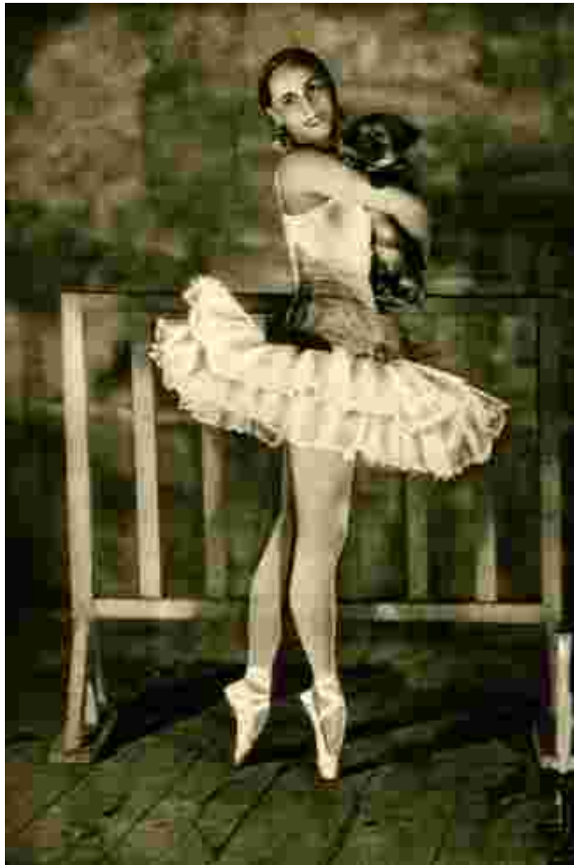
Анна Павлова, 1920-е

В 1950-х годах пачки становятся менее пышными, приплюснутыми — эта тенденция к минимализму закрепляется в 1960-е годы, когда юбочки превращаются в плоскую «тарелку».