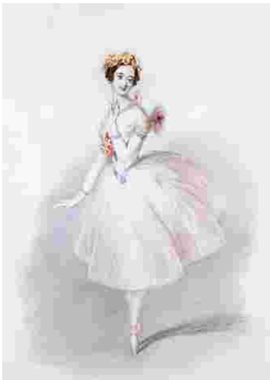
Мария Тальони в балете «Сильфида», литография 1832 года.

Эволюция балетного костюма, в том числе и женского сценического платья, находилась в зависимости от моды своего времени. Прообраз балетной пачки — пышная лёгкая юбка-«колокол» на корсаже, подчёркивающем узкую талию — появляется в самом начале 1830-х годов. Появление знаковой для балета лаконичной белоснежной пачки связывается с именем балерины Марии Тальони и балетом «Сильфида» (1832), костюмы к которому были выполнены по эскизам художника Эжена Лами. Хотя за год до этого Тальони уже танцевала в похожем платье в возобновлении балета Шарля Дидло «Зефир и Флора», именно «Сильфида», верно уловившая тенденции времени и впервые противопоставившая на сцене реальный и фантастический мир, стала своеобразным символом романтизма, предопределив развитие балета на следующие десятилетия.