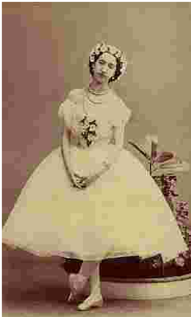
Эмма Ливри в балете «Сильфида», 1862

Став особенно пышной в 1850-х годах, с приходом моды на кринолины, пачка длиной до середины икры остаётся неизменной на протяжении нескольких следующих десятилетий. В конце XIX века резко уменьшается её длина — пачки 1880-х годов едва прикрывают коленную чашечку, тогда как пачки 1890-х годов уже полностью открывают колени и ноги до середины бедра..