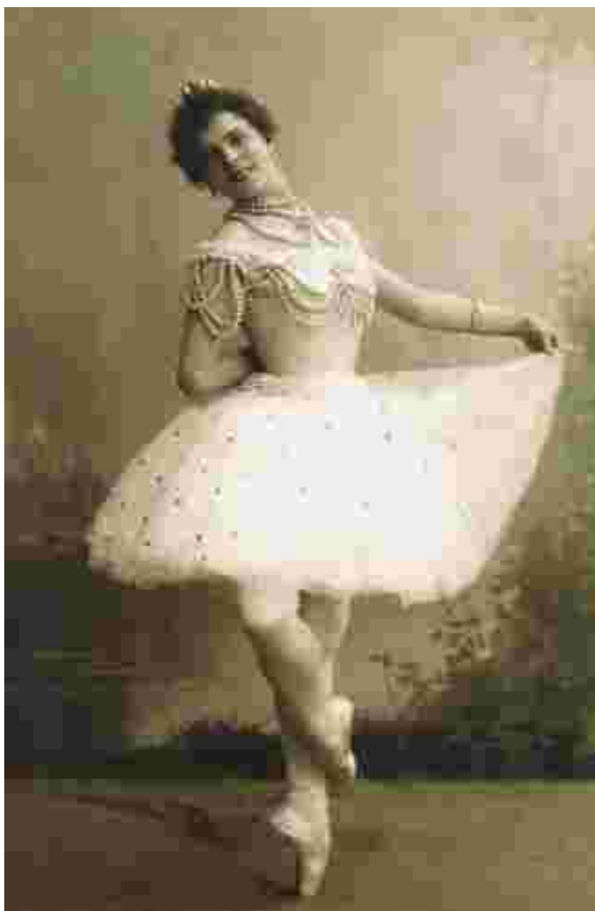
Пьерина Ленияни в балете «Жемчужина», 1890-е

Укорачивание костюма связано с развитием женской балетной техники — такая юбка уже не мешала делать многочисленные пируэты, фуэте и другие виртуозные движения