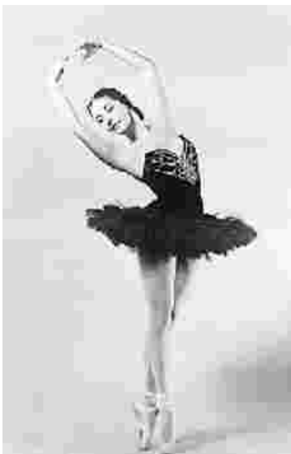
Алисия Алонсо в балете «Лебединое озеро», 1955

В 2000-х годах, с появлением моды на реконструкции старинных постановок, начиная со «Спящей красавицы» в Мариинском театре (1999), в крупнейших балетных театрах в моду вновь входит более женственный силуэт с пышной, ниспадающей до середины бедра юбкой по образцу конца XIX века.