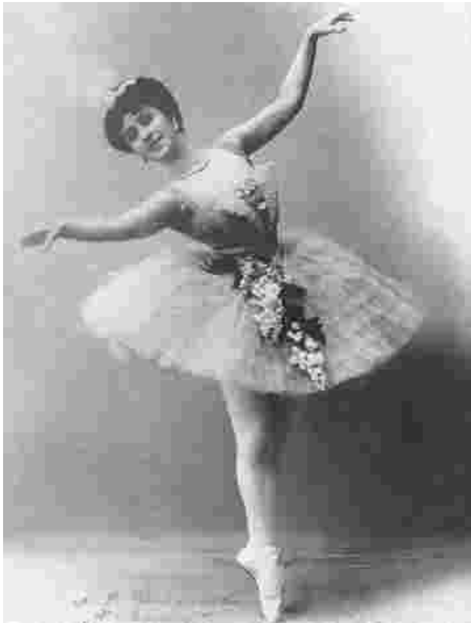
Матильда Кшесинская в балете «Талисман», ок. 1910

В XX веке стиль и форма юбки продолжали видоизменяться: в 1920-е годы, когда в моду вошла заниженная талия, пачка также спускается с талии вниз, на бёдра — чтобы закрепиться там окончательно. В 1930-х годах короткая пачка небольшого диаметра уже не ниспадает плавной линией вниз, а топорщится в стороны, чтобы сделаться практически горизонтальной, полностью открыв всю линию ног.